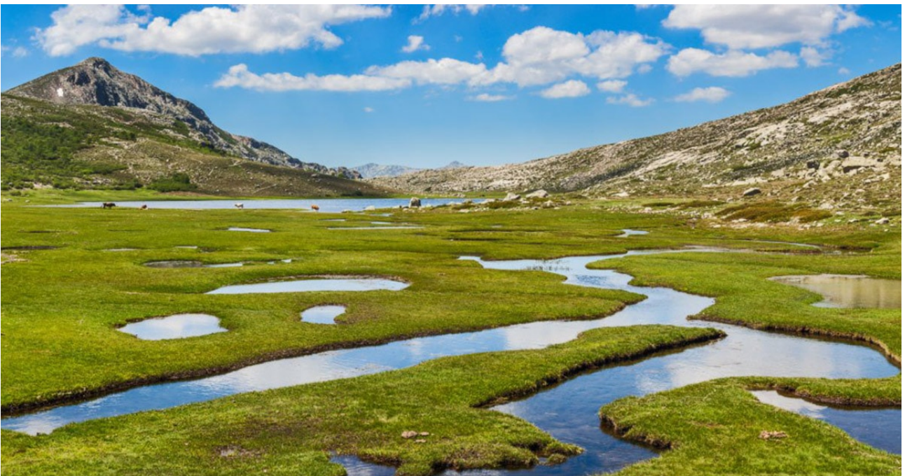
Plateau du Cuscionu